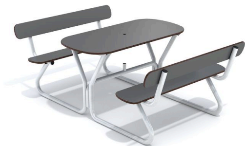
Picknickbord Allround från Hags

Grusytan är ca 44 m 2 och efter kontakt med Turbinen (markentreprenören i Klöverhagen) kan de utföra arbetet med att ta bort allt grus och ersätta det med jord. I ersättning accepterar Turbinen de befintliga bänkar som är placerade på grusytan idag. För att fortfarande ha sittmöjligheter föreslår styrelsen därför inköp av ett flyttbart picknickbord från Hags, se bild nedan. Att de föreslagna bänkarna har ett bord ger ett bredare användningsområde än nuvarande bänkar och att det dessutom är flyttbart utökar möjligheterna än mer för användning av den gemensamma gräsytan.